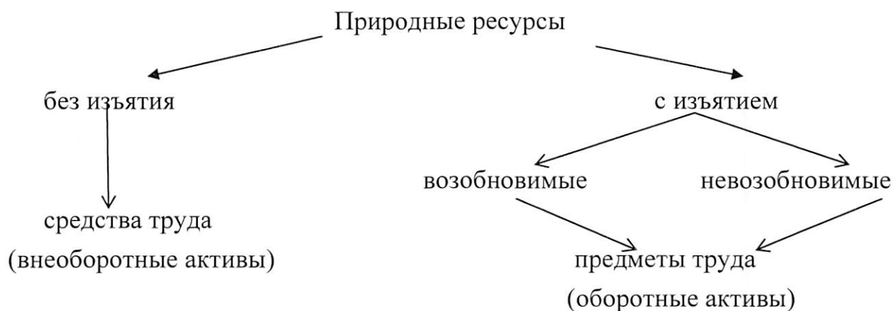
Рисунок 1 – Типология природных ресурсов в бухгалтерском учете

1. Обоснованы теоретические положения методологии бухгалтерского учета ресурсов лесозаготовительной деятельности, которые определяют изъятые из природной среды ресурсы в качестве запасов, что удовлетворяет условиям признания их в бухгалтерском учете, в отличие от действующей методологии бухгалтерского учета, включающей ресурсы лесозаготовительной деятельности в состав основных средств и не обеспечивающей надежность информации для принятия экономических решений; предложены методические подходы к формированию и раскрытию информации на основе признания партнерских отношений государства и лесозаготовителя и обеспечения солидарной ответственности партнеров за сохранение лесов по договору аренды. Действующие в настоящее время ФСБУ и отраслевые стандарты не обеспечивают надежности учетной информации, характеризующей осуществление лесозаготовок. Признание запасов древесины на корню объектом основных средств, представленное в ФСБУ 6/2020 «Основные средства», не позволяет квалифицировать объекты природопользования в зависимости от вида хозяйственного воздействия на природу, в частности с изъятием и без изъятия природных ресурсов (рис. 1).