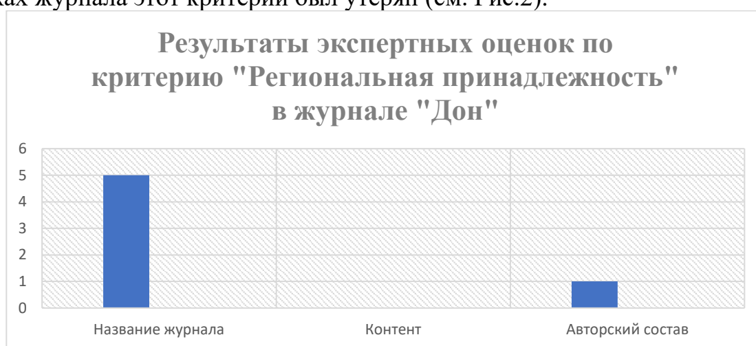
Рис. 2. Результаты экспертных оценок по критерию «региональная принадлежность» в журнале «Дон»

Журнал «Дон» является региональным, так как выходит в Ростове-на-Дону. В связи с этим был разработан критерий региональной принадлежности для региональных «толстых» журналов, к которому относится название, контент и авторский состав. По результатам оценки экспертов, определено, что современный журнал «Дон» длительное время соответствовал этому критерию, в современных выпусках журнала этот критерий был утерян (см. Рис.2).