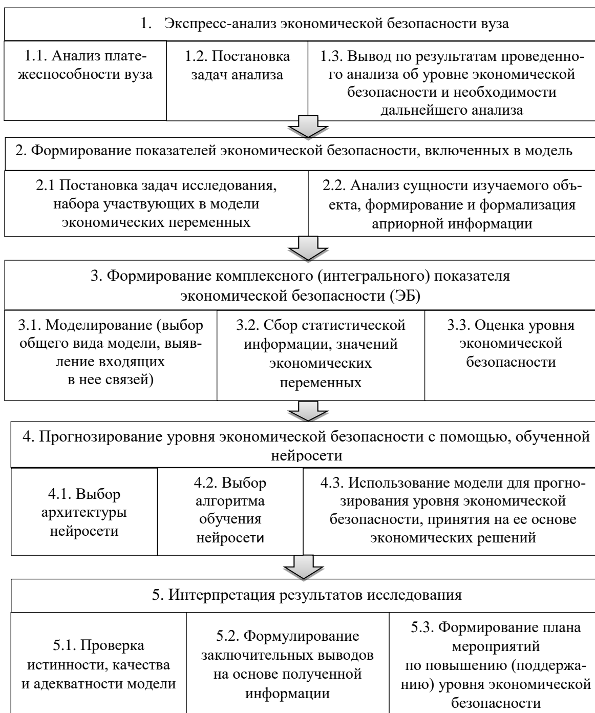
Рисунок 1 – Этапы и операции анализа экономической безопасности вуза на стадии реализации аналитических процедур

показателей, необходимая и достаточная для оценки уровня экономической безопасности вуза (таблица 3).