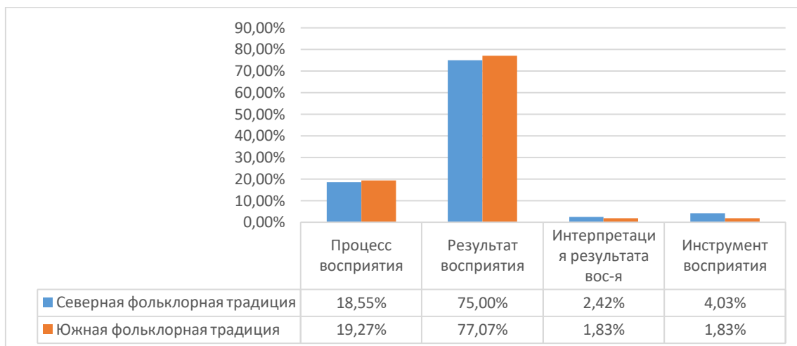
Рис. 2. Процентное соотношение ядерной лексики по составу ЛСГ в северной и южной фольклорных традициях

Произведенный комплексный сопоставительный анализ демонстрирует общность (критерии 1, 2, 4, 6, 8) и различия (критерии 3, 5, 7; интеграция критериев) репрезентации ПКМ, связанные с территорией фиксации мифологических рассказов.