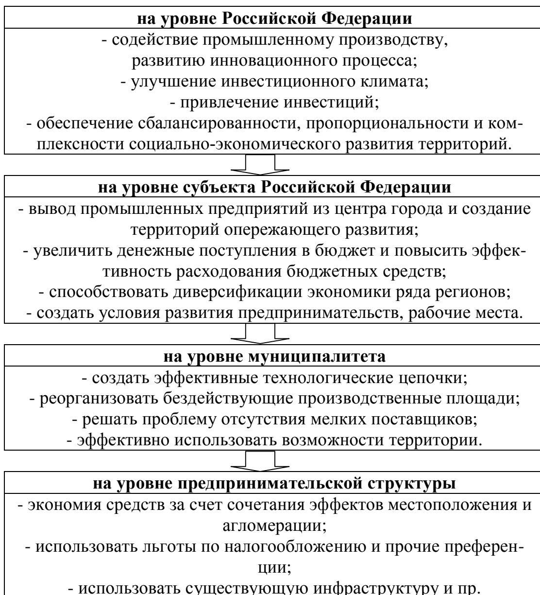
Рисунок 1. Роль индустриальных парков на разных уровнях

По мнению автора, создание и развитие индустриальных парков позволит решить целый ряд задач и проблем, которые условно разделены на 4 группы по следующим уровням: на уровне Российской Федерации в целом, на уровне субъекта Российской Федерации, на уровне муниципалитета, на уровне предпринимательской структуры (см. рисунок 1).