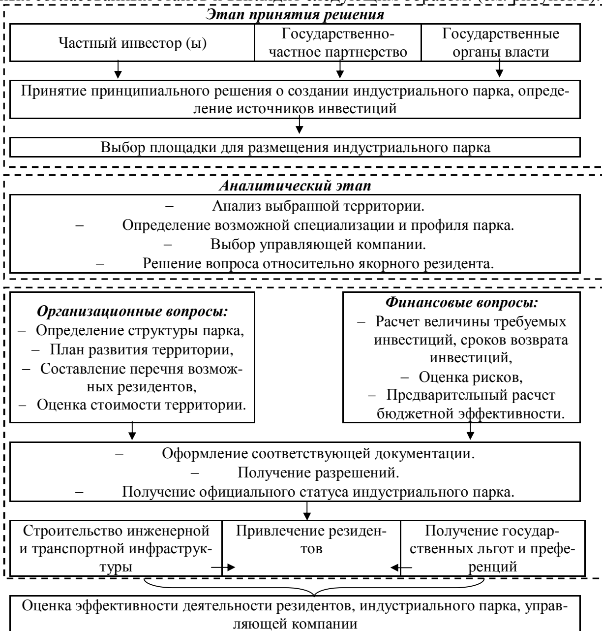
Рисунок 2. Модифицированный механизм создания индустриального парка

5. Модифицированный механизм создания индустриального парка на основе государственно-частного партнерства. В современной экономической действительности сложилась необходимость систематизации опыта создания индустриальных парков на основе государственно-частного партнерства, с целью выработки единого механизма, позволяющего сократить возможные риски, нивелировать существующие проблемы. Модифицированный механизм создания индустриального парка включает ряд последовательных согласованных этапов и выглядит следующим образом: (см. рисунок 2).