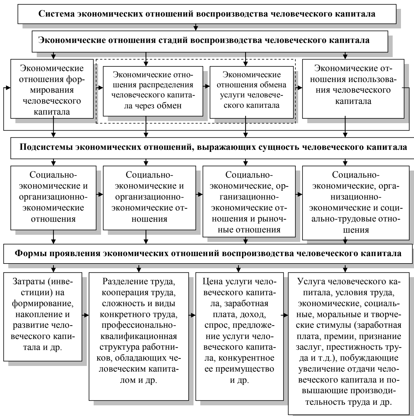
Рисунок 3 - Теоретическая модель экономических отношений воспроизводства человеческого капитала и форм их проявления