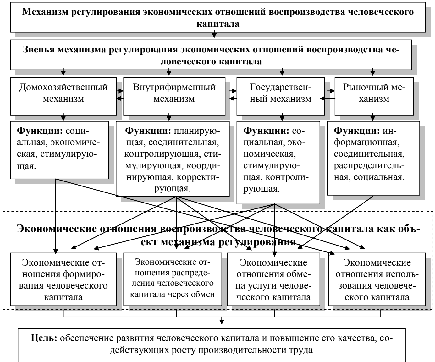
Рисунок 4 - Общая модель механизма регулирования экономических отношений воспроизводства человеческого капитала

ханизма регулирования экономических отношений воспроизводства человеческого капитала – обеспечение развития человеческого капитала и повышение его качества, содействующих росту производительности труда.