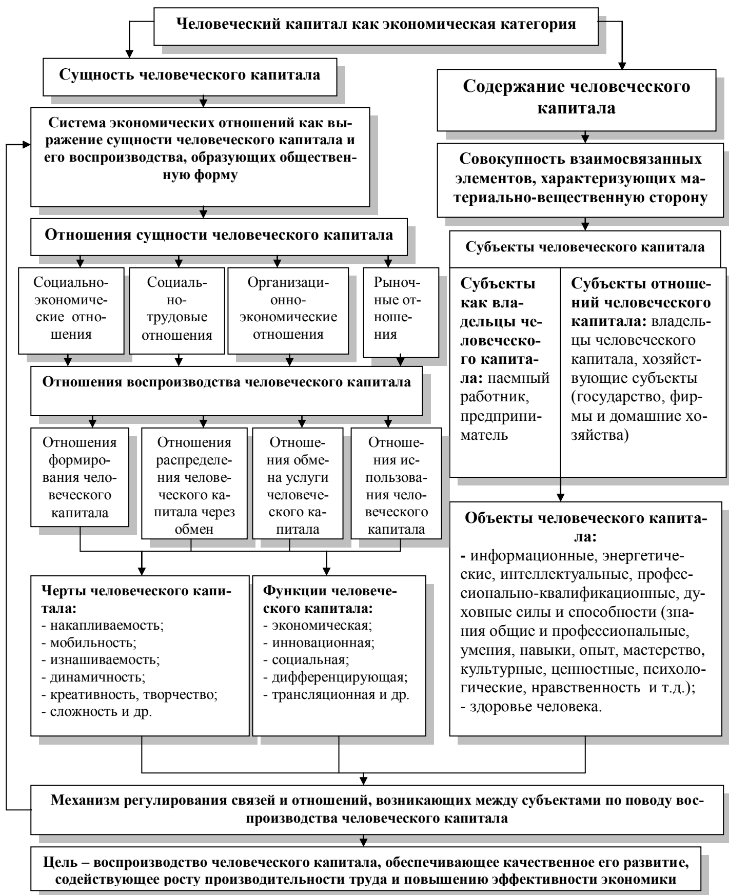
Рисунок 1 - Теоретическая модель человеческого капитала как экономической категории, построенная на основе воспроизводственного подхода к его раскрытию