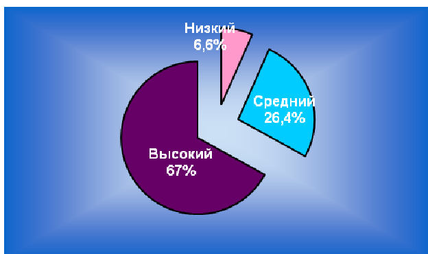
Рис. 4. Экспериментальная группа

(уровни на контрольном этапе эксперимента)