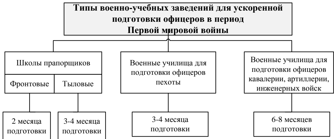
Рисунок 1. Типы военно-учебных заведений для ускоренной подготовки офицерских кадров в период Первой мировой войны

Таким образом, проанализировав опыт создания учебных программ для обучения ускоренных выпусков в военно-учебных заведениях во время Первой мировой войны, позволил сделать нам ряд выводов, которые влияли на качество подготовки офицерских кадров.