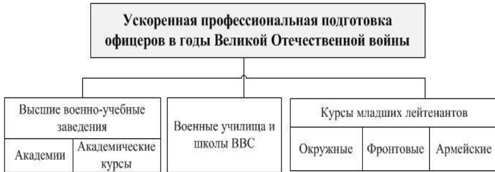
Рисунок 2. Структура военно-учебных заведений, осуществляющих ускоренную профессиональную подготовку в годы Великой Отечественной войны.

В военно-учебных заведениях обобщается и используется в подготовке будущих офицеров опыт, накопленный в ходе боевых действий.