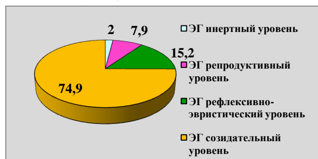
Рисунок 5 – Уровни развития творческих способностей подростков в ЭГ после формирующего эксперимента

Сравнительные данные КГ и ЭГ до и после формирующего эксперимента представлены на рисунке 6.