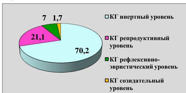
Рисунок 4 – Уровни развития творческих способностей подростков в КГ после формирующего эксперимента

По окончании опытно-экспериментальной работы мы провели контрольный срез для оценки качества реализации педагогического потенциала русской народной культуры и выявления динамики развития творческих способностей обучающихся с использованием тех же методик диагностики, что и на констатирующем этапе эксперимента. Анализ результатов эксперимента показал повышение уровня развития творческих способностей подростков в ЭГ в сравнении с КГ. В КГ на инертном уровне остались 70,2 % подростков, на репродуктивном – 21,1 %, на рефлексивно-эвристическом – 7 %, на созидательном – 1,7 %. В ЭГ на инертном уровне остались 2 % подростков, на репродуктивном – 7,9 %, на рефлексивно-эвристическом – 15,2 %, на созидательном – 74,9 % (Рисунки 4, 5).