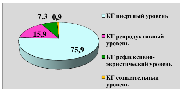
Рисунок 2 – Уровни развития творческих способностей подростков в КГ на констатирующем этапе эксперимента

Анализ результатов констатирующего этапа эксперимента показал что, в КГ на инертном уровне развития творческих способностей находятся 75,9 % подростков, на репродуктивном – 15,9 %, на рефлексивно-эвристическом – 7,3 %, на созидательном – 0,9 %. В ЭГ на инертном уровне развития творческих способностей находятся 76,4%, на репродуктивном – 15,1 %, на рефлексивно-эвристическом – 7,5%, на созидательном – 1 % (Рисунки 2 и 3).