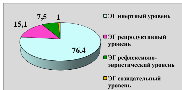
Рисунок 3 – Уровни развития творческих способностей подростков в ЭГ на констатирующем этапе эксперимента

В процессе опытно-экспериментальной работы мы определили наиболее ярких представителей каждого уровня, что позволило описать их монографические характеристики и выделить факторы и педагогические условия, которые меняются в зависимости от уровня развития творческих способностей. Основопологающими инвариантными факторами являются историко-региональные особенности этнокультурной среды; этнокультурные ценностные ориентации подростка; потребность подростка в самосовершенствовании; поиск своего творческого «Я» в контексте русской народной культуры; мотивы этнокультуросообразной творческой деятельности; стремление к признанию окружающими; значимое для подростка событие; особенности творческой личности подростка и его способностей, его характер, темперамент, склонности и творческие интересы. Основопологающими инвариантными педагогическими условиями являются актуализация деятельностного патриотизма в творчестве подростка; проектирование образовательного пространства русской народной культуры; включение подростка в этнокультуросообразную творческую деятельность; обеспечение творческой атмосферы и предоставление внутренней свободы и самостоятельности в выборе творческих решений; актуализация в творчестве художественно-образной выразительности русской народной культуры; воспитание духовно-нравственной культуры подростка; субъект-субъектное взаимодействие; конструирование образовательного процесса с учетом индивидуально-личностных характеристик подростка.