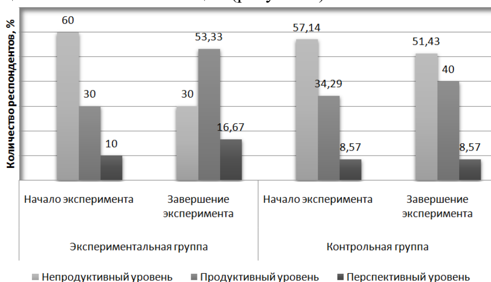
Рисунок 3 – Распределение студентов – будущих учителей физической культуры по уровням сформированности социально-активной позиции личности на начальном и завершающем этапах формирующего эксперимента

Основная цель исследования – обосновать и экспериментально проверить эффективность педагогической модели формирования социально-активной позиции студента-будущего учителя физической культуры в спортивно-образовательном кластере вуза способствует успешному развитию компонентов социально-активной позиции (рисунок 3).