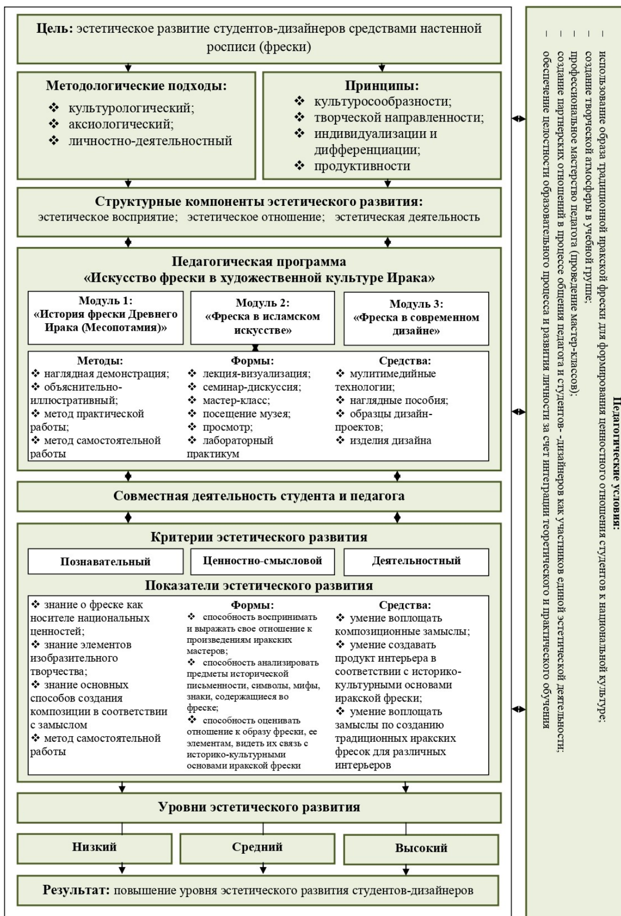
Рисунок 1 – Модель эстетического развития российских студентов-дизайнеров средствами иракской настенной росписи (фрески)