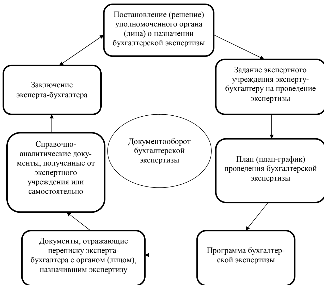
Рисунок 3 – Схема документооборота экспертной бухгалтерской деятельности

На основе анализа различных научных источников и существующей практики была разработана схема документооборота бухгалтерской экспертизы, отражающая порядок движения экспертных документов с момента их получения (оформления) до реализации в экспертном заключении. Разработанная схема позволяет упорядочить документационное обеспечение экспертной бухгалтерской работы и информационный обмен в процессе осуществления экспертной деятельности.