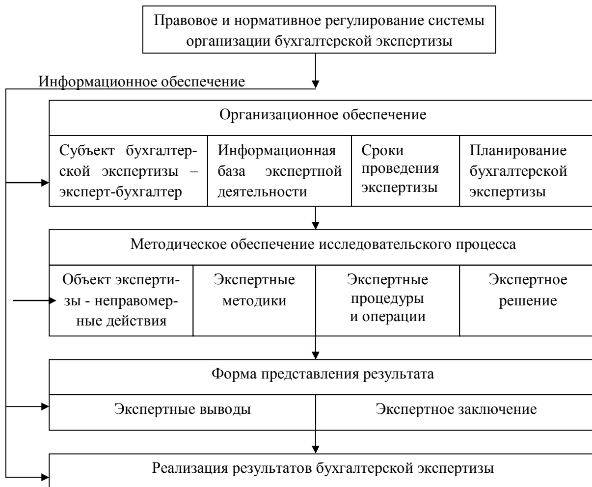
Рисунок 1 – Организационный механизм бухгалтерской экспертизы

Схематично структурные элементы организационного механизма бухгалтерской экспертизы представлены на рисунке 1.