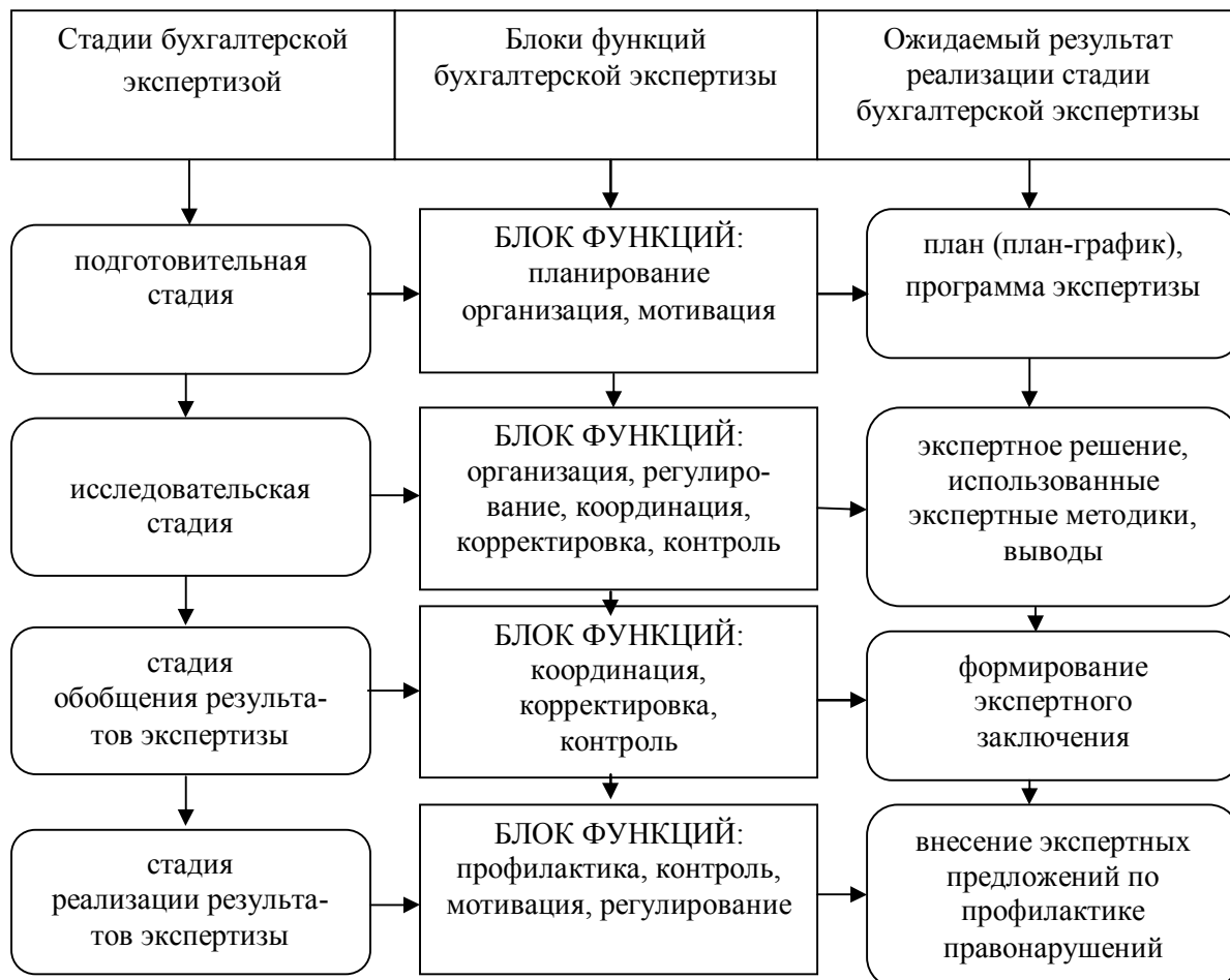
Рисунок 2 – Схема реализация функций бухгалтерской экспертизы на отдельных ее стадиях

В ходе рассмотрения организации бухгалтерской экспертизы установлено, что выделенные её стадии и функции имеют определенный состав и взаимосвязь. В связи с этим для каждой стадии бухгалтерской экспертизы определены реализующие ее функции и характер ожидаемых результатов реализации соответствующей стадии (рисунок 2).