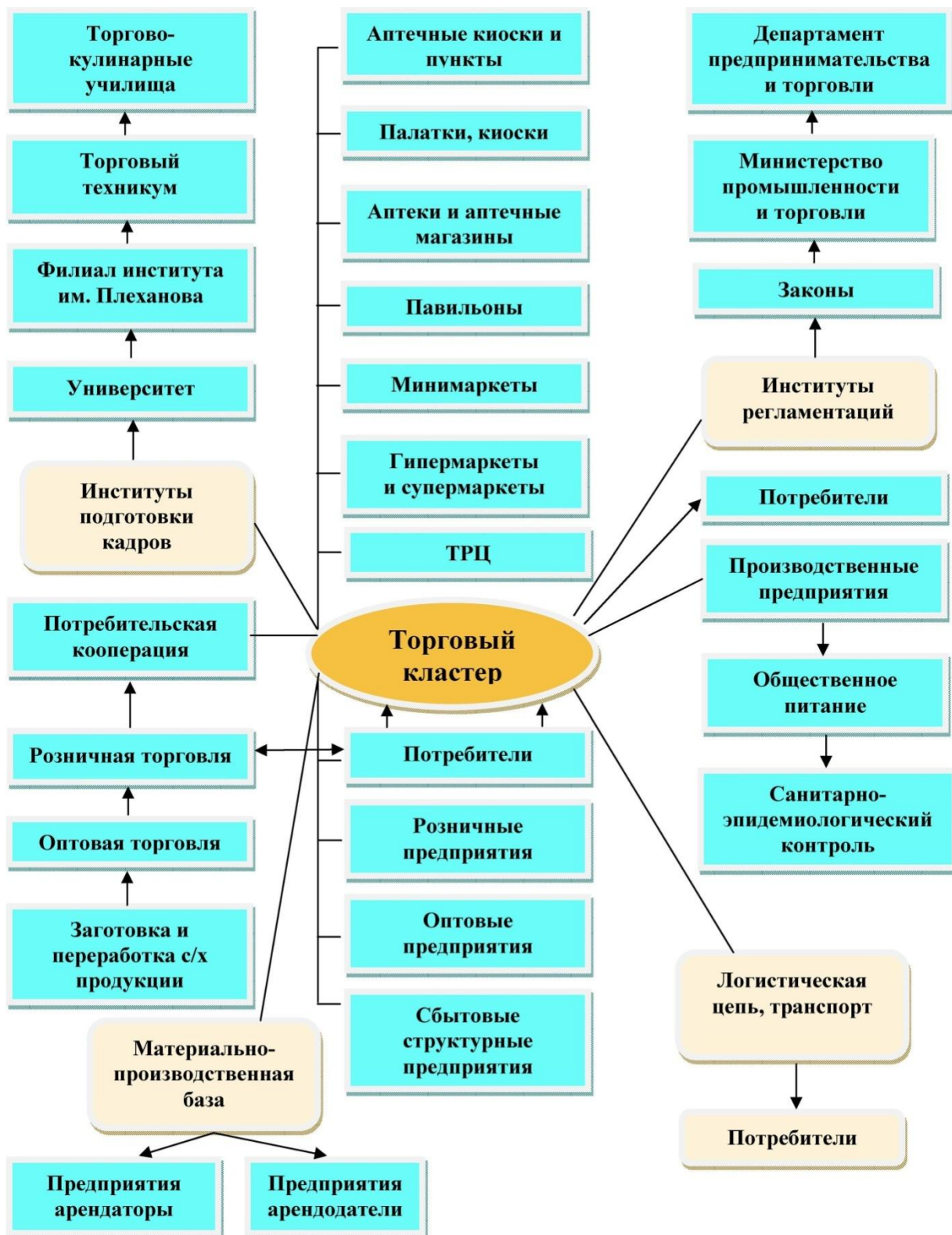
Рисунок 3 – Модель торгово-сельскохозяйственного кластера (применительно к Воронежской области)

- в контексте функционирования экономико-организационной подсистемы механизма, действующей на микроуровне (меры стимулирования