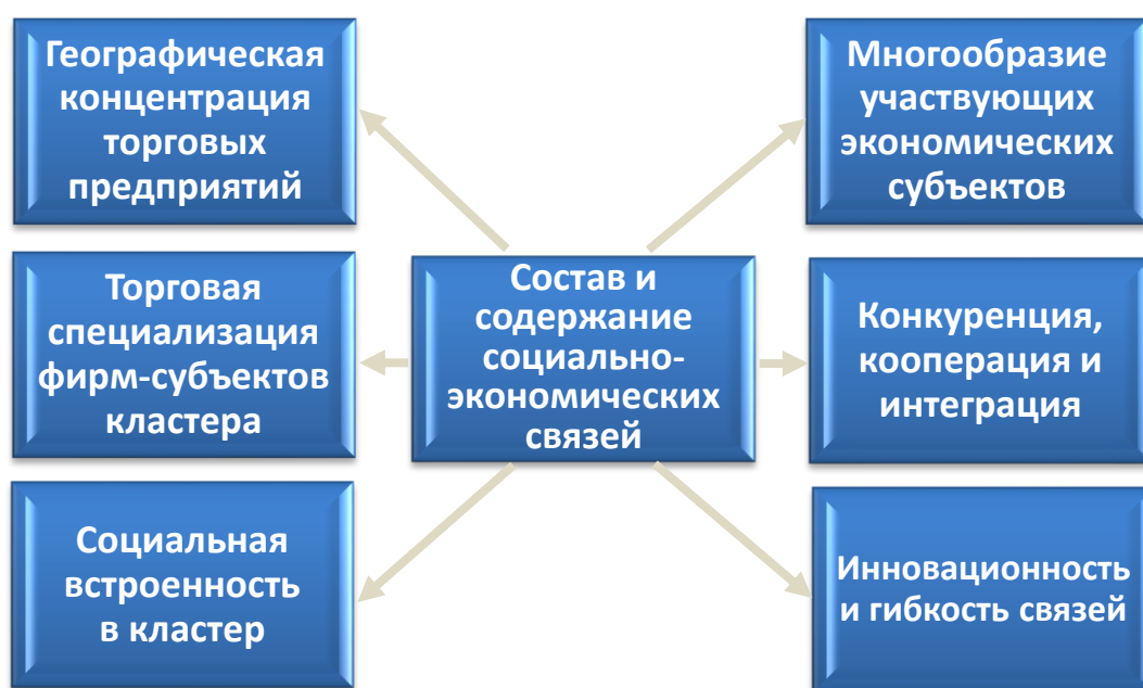
Рисунок 2 – Состав и содержание социально-экономических связей торговых кластеров

- с позиций состава и содержания связей – инвариантное представление механизма (рисунок 2);