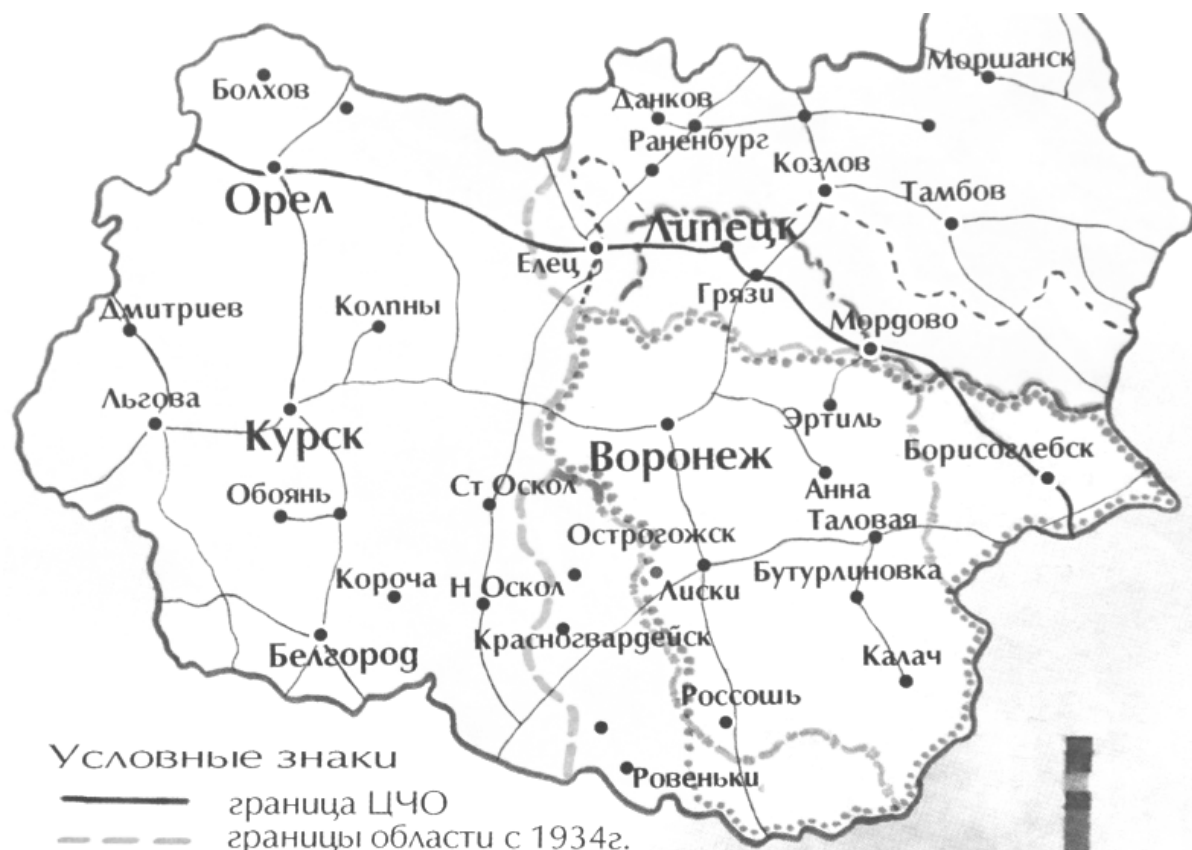
Карта Центрально-Черноземной области (ЦЧО) и Воронежской области с обозначением границ в 1934 г.

Верхне-Донская область в повести напоминает реальную Центрально-Чернозёмную область, которая была образована в 1928 году с центром – город Воронеж.