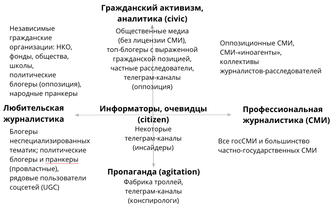
Рис. 3. Распределение источников информации по характеру информационной активности и принадлежности к профессии

Таким образом, гражданская журналистика развивается по компенсаторному принципу, и чем строже регулирование, тем больший общественный запрос на разностороннее информирование. Раздвоение повестки «партии телевизора» и «партии интернета» приводит к большей поляризации в обществе, при этом противоположные подходы к работе с информацией усиливают значимость друг друга. Новый подход к классификации журналистики в новых медиа возможен только через анализ совокупности всех участников медиасреды.