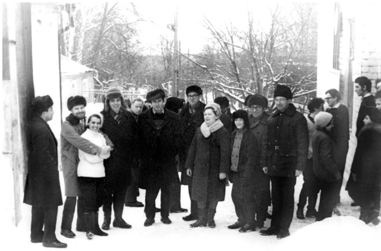
ВЗМШ на турбазе «Коммунальник» под Воронежем.

Общение с интересными людьми как в профессиональном, так и в культурно-эстетическом плане внесло в нашу жизнь незабываемо яркие страницы. В большой степени этому способствовали ВЗМШ, организатором и душой которых был С. Г. Крейн.