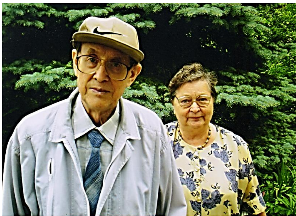
Чета Борисовичей. 28 июня 2005 г.

умных, порядочных, преданных науке молодых математиков. И, что большая редкость в наше время, благодарных. Все они состоялись как ученые, защитили кандидатские и докторские диссертации, создали свои научные направления. Многие из них стали для моих родителей друзьями на всю жизнь.