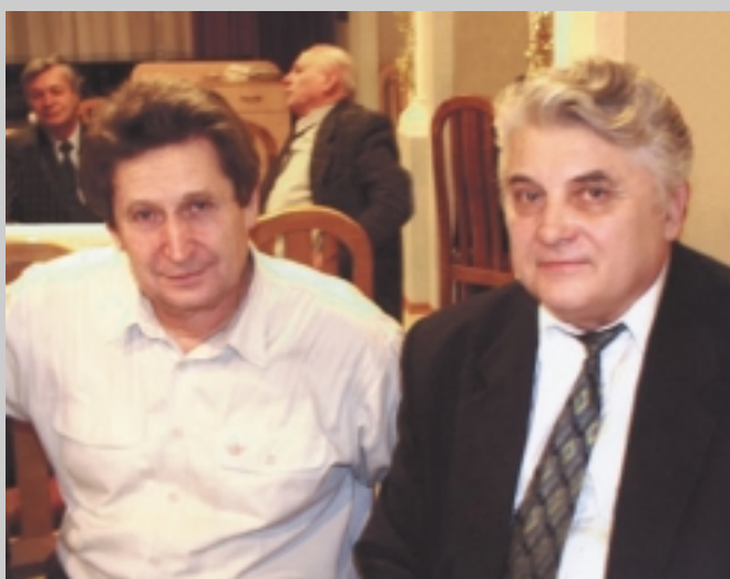
Академик РАН А.П.Деревянко и проф. А.Д.Пряхин (отчетная сессия Института археологии и этнографии СО РАН. Новосибирск, 2000)

лось потребностью обеспечения учебного процесса в системе специализации. Собственно в учебном процессе рождалась книга по истории советской археологии /Пряхин А.Д. История советской археологии. Воронеж, 1986 /, а в рамках соответствующего спецсеминара — книга «Археологи уходящего века» /Пряхин А.Д. Археологи уходящего века. Воронеж, 1999 /. Конечно же, это и имеющие историографическую направленность курсовые и дипломные работы, отдельные из которых затем перерастают в тематику