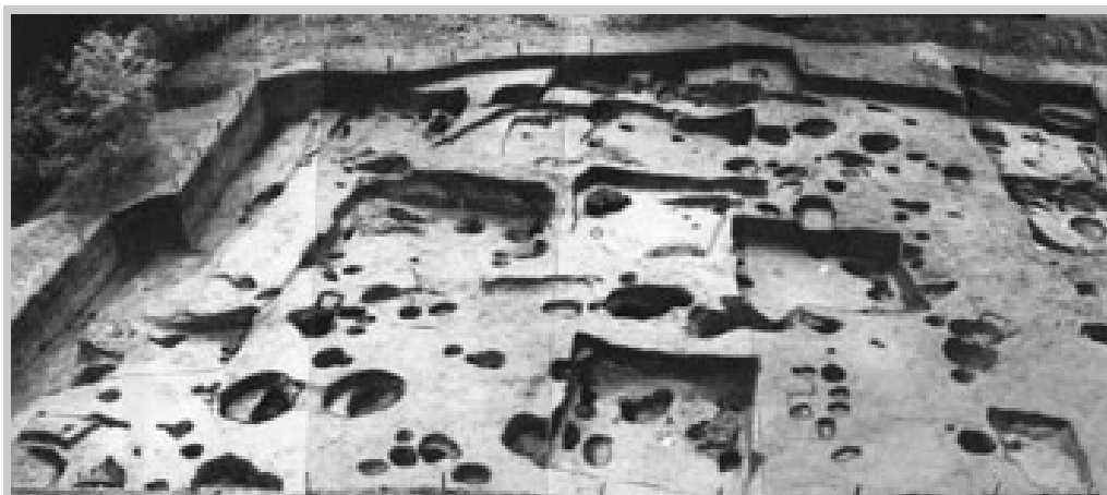
Вскрытый раскопками участок на Животинном городище древнерусского времени

В 1984 г. А.З.Винниковым публикуется монографическое исследование, посвященное анализу славянских курганных древностей лесостепного Подонья, где обосновывается выделение среднедонской и воронежской групп памятников боршевского типа, предложена во многом новая трактовка проблемы взаимодействия славянского и алано-болгарского миров /Винников А.З. Славянские курганы лесостепного Дона. Воронеж, 1984 /.