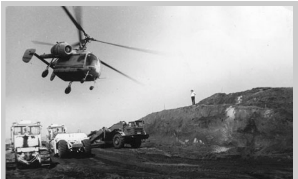
Новостроечные раскопки одного из самых крупных курганов на территории лесостепи (Усманский курган, 1988 г.)