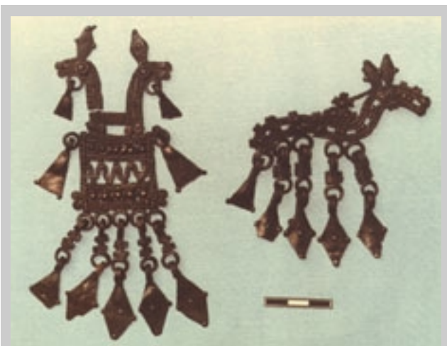
Коньковые подвески из культовых комплексов с территории Маяцкого селища раннего средневековья