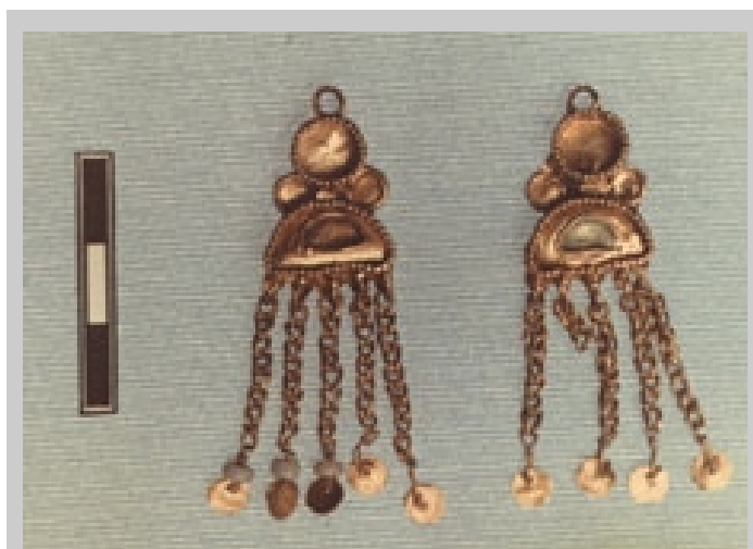
Золотые серьги из одного из погребений Чертовицкого могильника сарматского времени первых веков I тыс.н.э.

ня). Воронеж, 1990/. Диссертационное исследование по историографии археологии (осмысление достигнутого советской археологией в изучении скотоводческих обществ эпохи бронзы и раннего железного века Евразийской степи) выполнил Н.П.Писаревский. Во второй половине 80-х гг. А.П.Медведев руководит раскопками Пекшевского городища на р. Воронеж, в результате чего впервые для