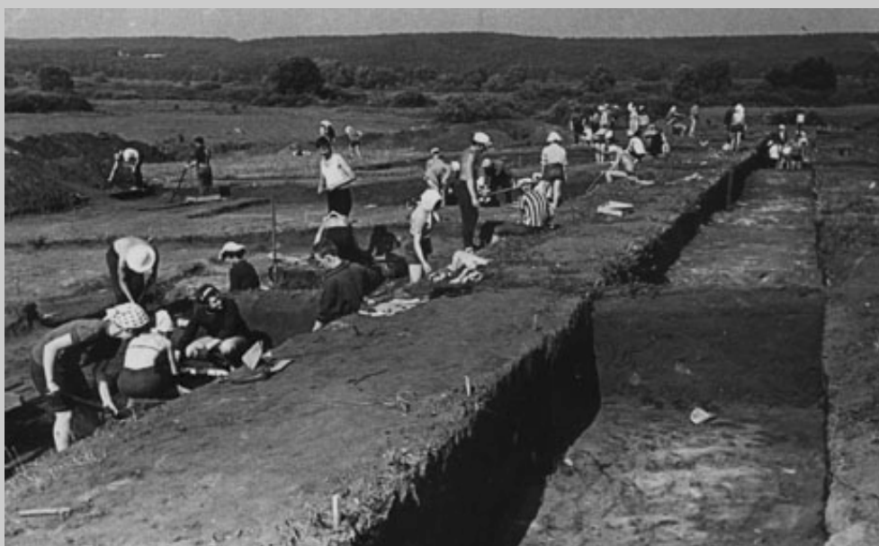
Раскопки Шиловского поселения в зоне Воронежского водохранилища (1970 г.) (ныне — дно водохранилища)

кой кафедры археологии. Иными словами, в рамках экспедиции формировалось археологическое ядро будущей кафедры. Но не менее важным оказалось и то, что работы совместной экспедиции явились своего рода фундаментом развития всестороннего сотрудничества исторического факультета Воронежского госуниверситета с Институтом археологии Академии наук страны.