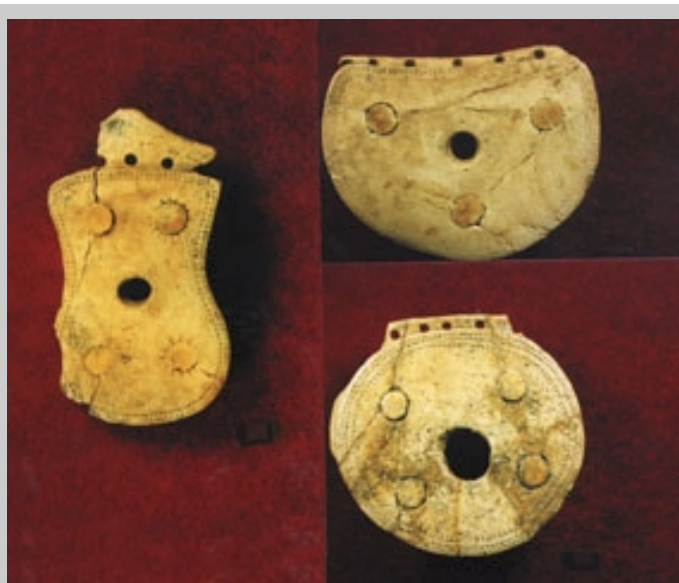
Предметы конской упряжи колесниц первой половины II тыс. до н.э. из кургана 1 могильника Селезни-2

Работа экспедиции и проведение на ее базе ежегодных совместных полевых археологических семинаров по проблематике эпохи