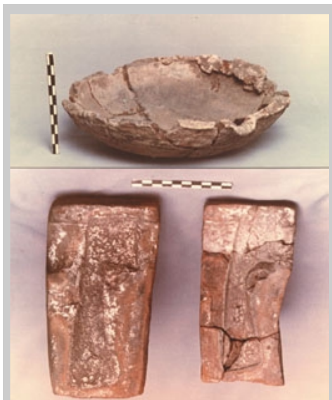
Плавильная чаша и литейные формы для отливки топоров с Мосоловского поселения металлургов-литейщиков второй половины II тыс. до н. э.

селения абашевской общности. Воронеж, 1976; Пряхин А.Д. Погребальные абашевские памятники. Воронеж, 1977/. Тогда были выделены и охарактеризованы три абашевские культуры, среди которых и доно-волжская абашевская, занимающая ведущие позиции в этой общности. Памятники же типа Синташта были отнесены к зауральскому варианту уральской абашевской культуры. Особую значимость приобретают получившие во второй половине 70-х — первой половине 80-х гг. значительный размах исследования упоминавшегося Мосоловского поселения металлургов-литейщиков. Обозначилась потребность в изучении памятника большей частью площади, что обеспе-